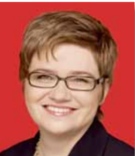
Anette Kramme, MdB