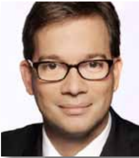
Florian Pronold, MdB