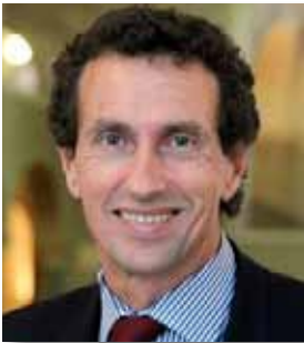
Prof. Dr. Julian Nida-Rümelin