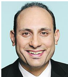
Ismail Ertug, MdEP