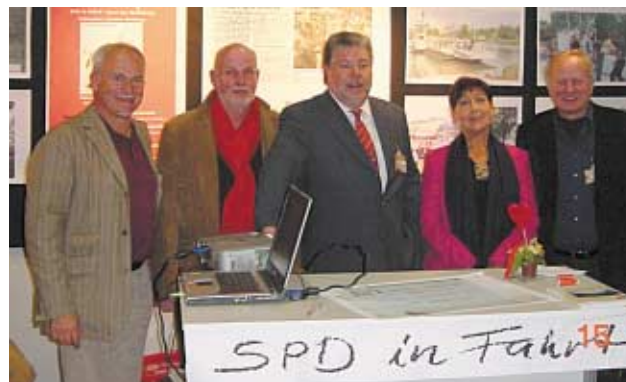
Der stellvertretende SPD-Vorsitzende, Ministerpräsident Kurt Beck , war begeistert von der Idee der Oberpfälzer Genossen.