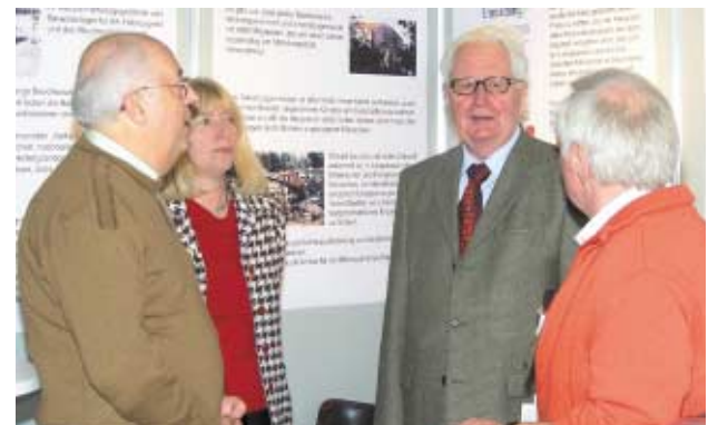
Auch bei Hans-Jochen Vogel fand der Drexler-Preis der SPD Nürnberg-Langwasser großes Interesse.

nen sollten den Besuchern dies- und jenseits der Donau die Schönheit und Erhaltungswürdigkeit der Uferlandschaft vor Augen geführt werden. Zum andern galt es, einen Beitrag zur Sympathiewerbung für die SPD zu leisten und Flagge zu zeigen für die SPD in der schwierigen Zeit des Wahlkampfes 2005. ■