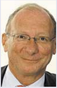
AN FRANZ MAGET, VORSITZENDER DER SPD-FRAKTION IM BAYERISCHEN LANDTAG

Die SPD steht mit der CSU in Regierungsverantwortung auf der Bundesebene; In Bayern ist sie Opposition zur CSU – wie wirkt sich die Berliner Koalition auf die Arbeit im Landtag aus?