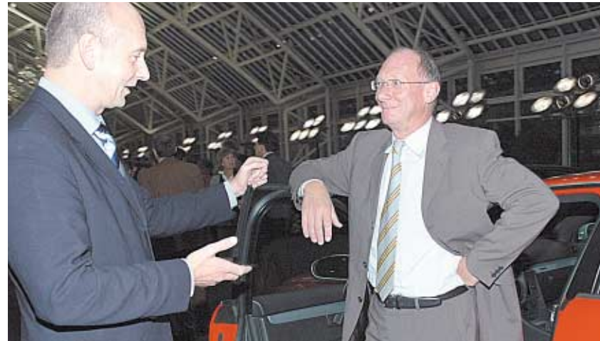
SPD-Fraktionschef Franz Maget lässt sich in der Ingolstädter Zentrale von Audi-Personalvorstand Josef Schelchshorn die neuen Modelle zeigen.

Die „BMW Welt“ soll ein zentraler Ort der Begegnung für Kunden und Öffentlichkeit werden. Neben der Fahrzeugauslieferung sind Geschäfte, Gastronomie, Ausstellungen sowie Kongress- und Kulturveranstaltungen geplant. Bis zu 250 Kunden können dort täglich ihr neues Auto abholen. Insgesamt werden rund 850.000 Besucher im Jahr erwartet.