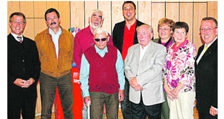
90 Jahre SPD Pfuhl-Burlafingen.