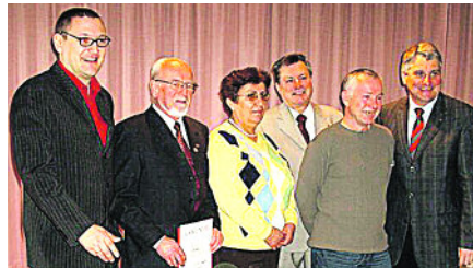
90 Jahre SPD Marktobendorf.

Laufe des Bestehens nie ändern musste. In der heutigen politischen Situation seien die Grundwerte der Partei notwendig, denn die Gesellschaft sei aus den Fugen geraten.