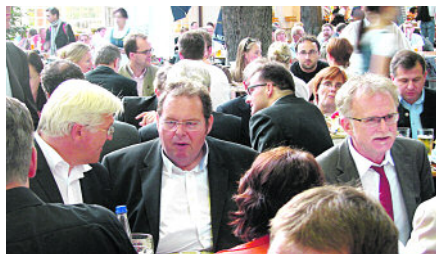
Seite an Seite auf dem Nockherberg: Frank-Walter Steinmeier und Ottfried Fischer.