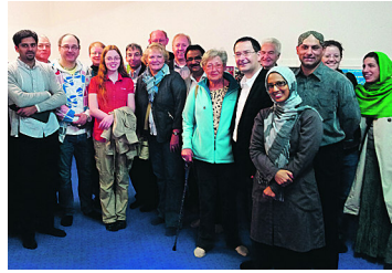
„Zeichen setzen“ gegen die Anti-Minarett-Propaganda der CSU