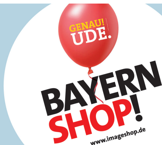
IMAGE mbH · Deichstraße 47 · 20459 Hamburg Telefon 040/28400315 · Fax 040/28400316