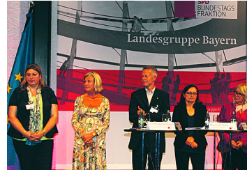
„Neue Wege für eine gute Pflege“ gesucht!